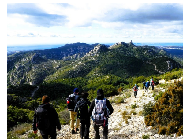
La Baou Trauqua (février 2024)