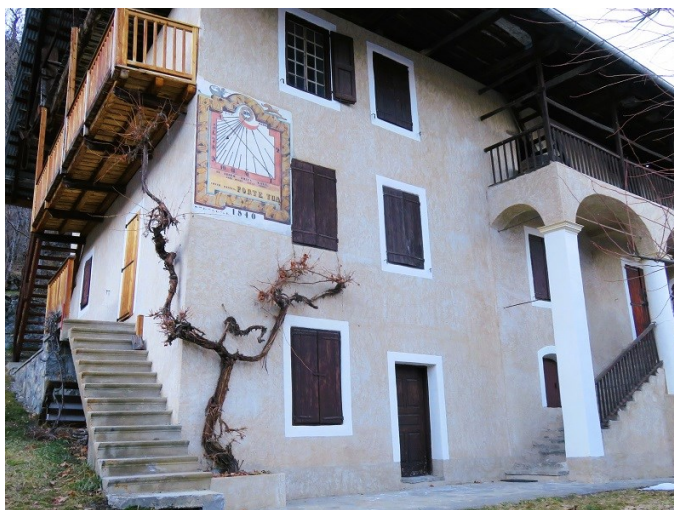
WE Raquettes neige Vallouise Pelvoux (Février 2024)

I = Itinéraire ou séjour inédit « Marche et Rêve »