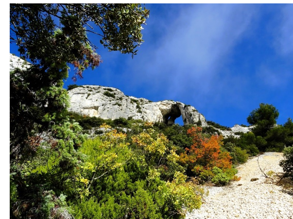
Portalas / Luberon (novembre 2023)