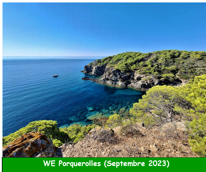
WE Porquerolles (Septembre 2023)

I = Itinéraire ou séjour inédit « Marche et Rêve »